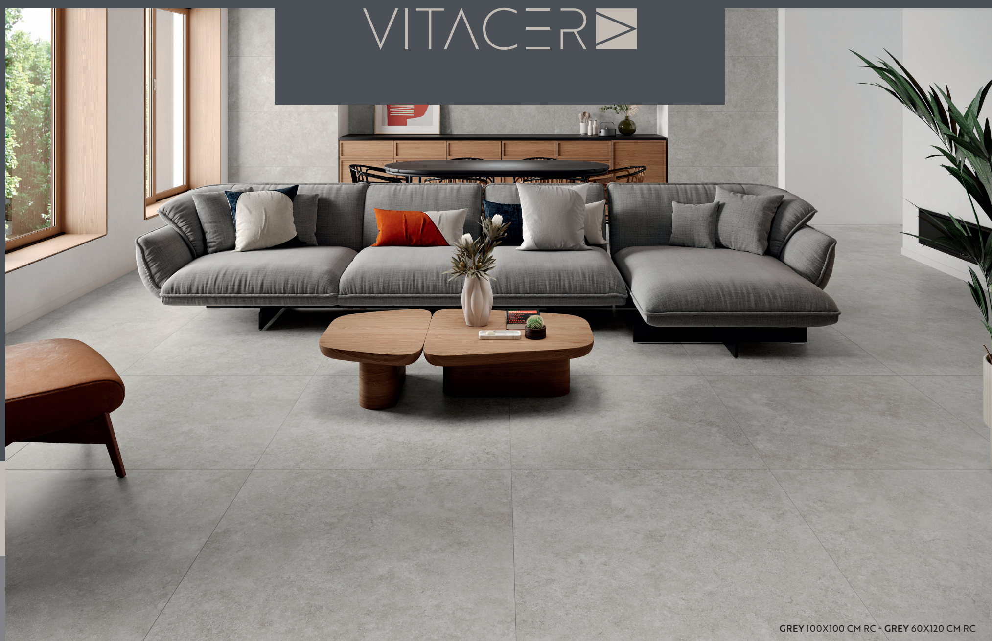
GREY 100X100 CM RC - GREY 60X120 CM RC