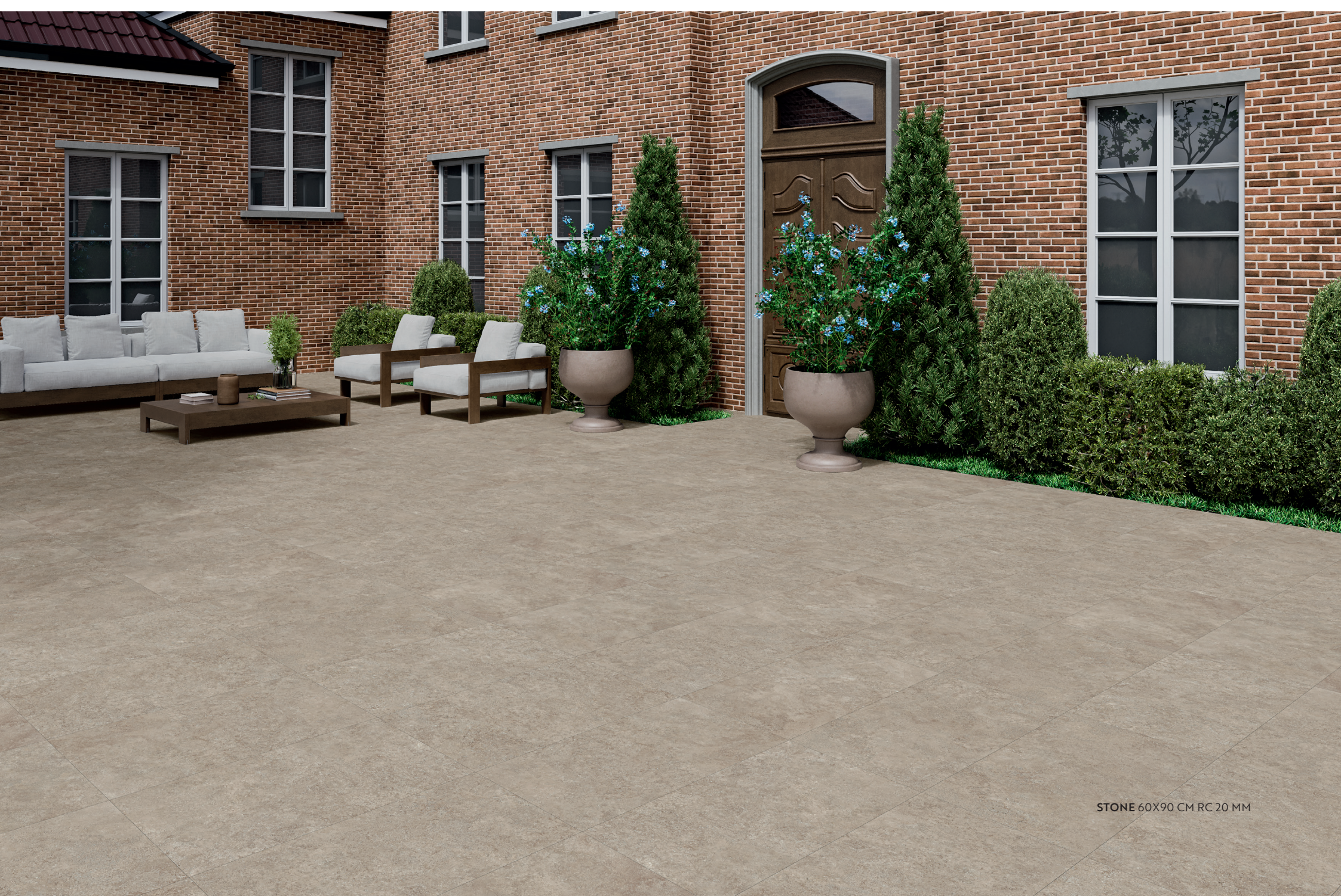
STONE 60X90 CM RC 20 MM